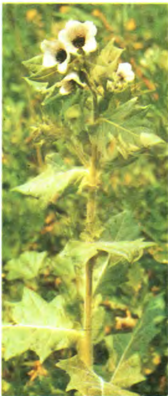
572. Блекота чорна.